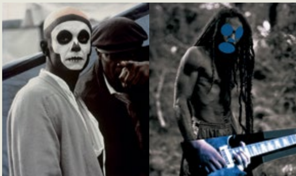
Arthur Jafa, Mickey Mouse Was a Scorpio , 2017 (particolare). Collezione privata © Arthur Jafa / Midnight Robber Richard Prince, Graduation , 2008. Collezione Larry Gagosian © Richard Prince